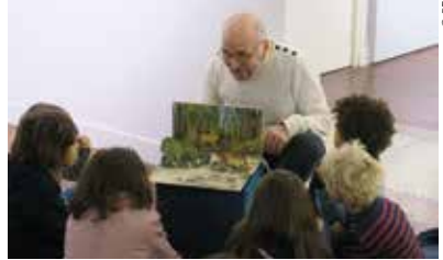
La malle aux histoires

Les mercredis à 10h30, hors vacances scolaires