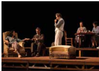
Un mois à la campagne

L'arrivée du précepteur Alexei dans la maison d'Arkady et Natalia vient bouleverser l'indolence du couple. Entre chassés-croisés amoureux et esprit de troupe, Clément Hervieu-Léger nous enchante avec sa mise en scène de Tourgueniev.