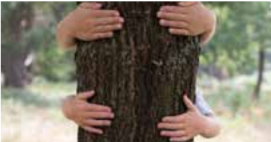
Petit rendez-vous en nature

Deuxième rendez-vous d'un cycle dédié aux tout-petits, afin de les inviter à explorer les relations avec les animaux, les plantes, la terre, et s'initier au spectacle vivant. Dans le cadre du dispositif de la Cité Éducative porté par la Direction enfance jeunesse éducation.