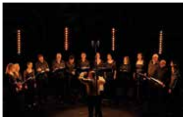
Le Chœur Bayonne Pays Basque