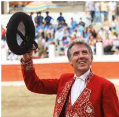
Pablo Hermoso de Mendoza