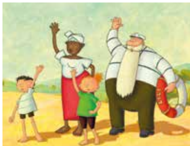
La prophétie des grenouilles

Film d'animation de Jacques-Rémy Girerd 2003 – À partir de 6 ans.