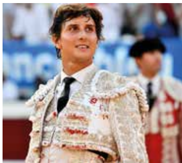
Andrés Roca Rey

Andres Roca Rey, numéro 1 absolu depuis plusieurs saisons est la star de cette Feria de l'Atlantique. À ses côtés, Juan Ortega et Adrien Salenc sauront enflammer le public et mettre la barre haute pour rivaliser avec l'idole des aficionados.