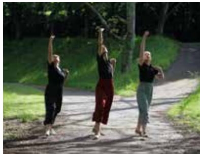
Le Collectif Ninika

Pour leur première création de danse contemporaine, les artistes du Collectif Ninika, plongent dans l'univers du conte. À l'image des garçons perdus de Peter Pan , le récit de J.M. Barrie, Les Enfants Perdus de Ninika souhaite danser dans un pays imaginaire. Rattrapés par une réalité qu'ils découvrent, les interprètes travaillent à danser et jouer des contraintes pour les rendre instruments de leur imagination.