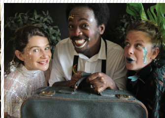
Cie Brasil Sunshine