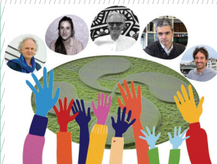
Table ronde © DR