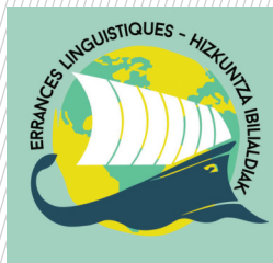
Expo Errances linguistique