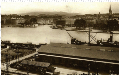
Quais de Lesseps