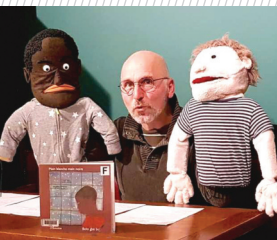
Main blanche main noire © Doris Uebel