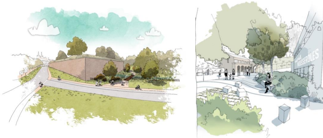
Perspectives du parc de Mousserolles – image de gauche, secteur Bastion royal – image de droite, accès vers la porte de Mousserolles

La Ville de Bayonne engage la mise en œuvre de son schéma directeur d'aménagement voté en conseil municipal le 17 octobre 2024, visant à rénover et valoriser le Parc de Mousserolles, un site naturel de 6 hectares inscrit aux monuments historiques. Ce projet, après concertation avec les habitants et en lien avec les Conseils de Quartiers, ambitionne de requalifier cette ceinture verte et les 4 entrées. Il propose de créer un espace écologique intégrant le jardin partagé et une gestion des prairies par écopâturage, un espace de loisirs et un espace culturel, pour une réappropriation du site par les Bayonnaises et les Bayonnais. Pour en faciliter l'accès, le projet intègre aussi la rénovation des cheminements doux et l'installation de mobilier urbain. Les travaux du secteur Bastion Royal ont débuté en janvier 2025, prochainement une passerelle sera installée pour relier cet espace au reste du parc du parc de Mousserolles.