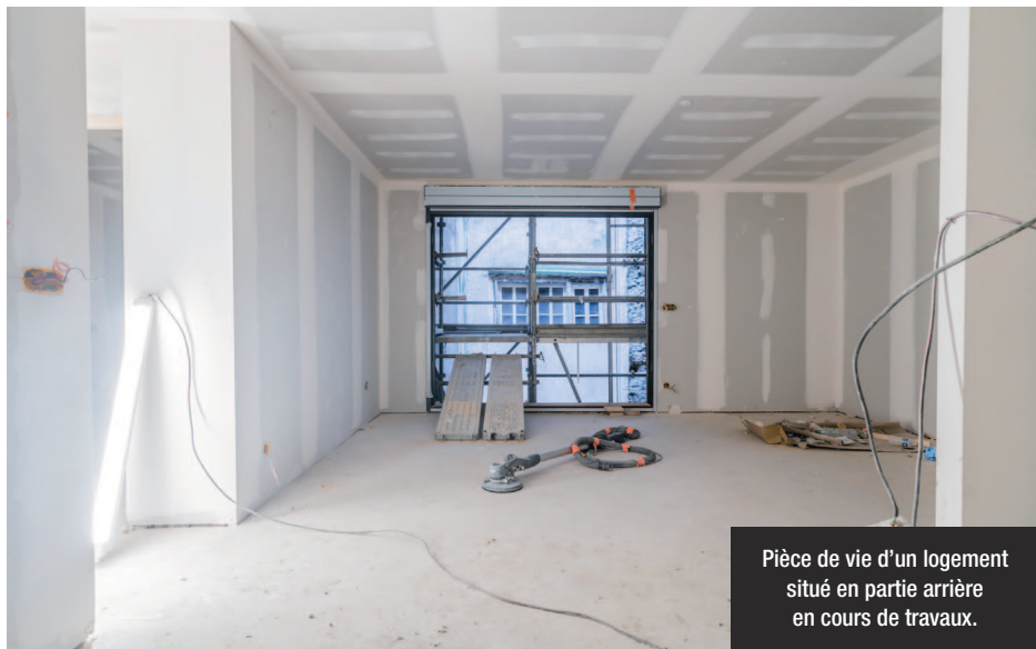
Pièce de vie d'un logement situé en partie arrière en cours de travaux.

VILLE DE BAYONNE - DIRECTION DE LA COMMUNICATION - JUIN 2021 - IMPRIMEUR CERTIFIÉ LABEL IMPRIM'VERT