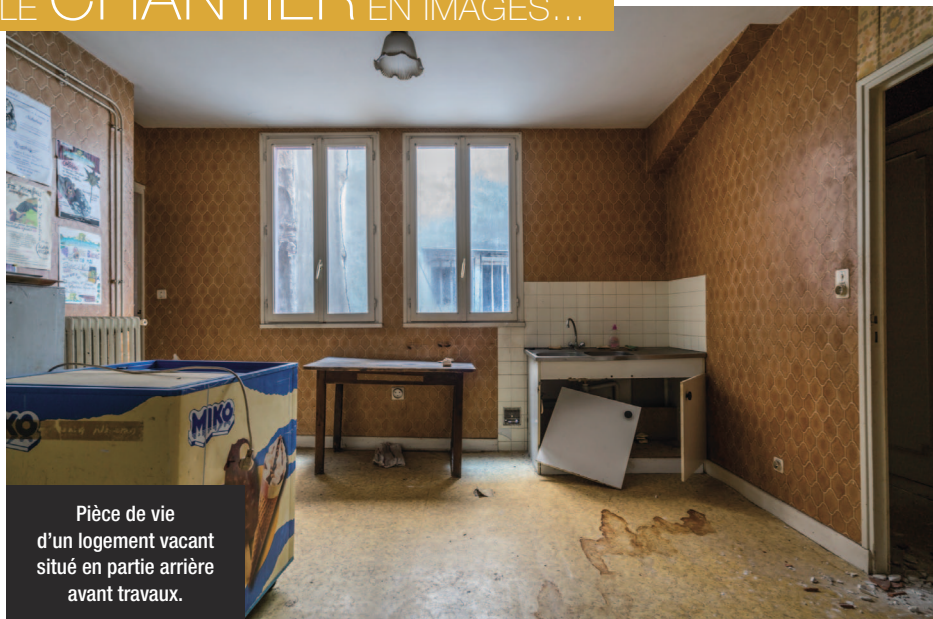
Pièce de vie d'un logement vacant situé en partie arrière avant travaux.